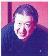
落語 三遊亭 良楽