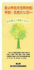
センターリーフレット

また、地域で行われるケア会議や認知症疾患医療センター等の会議に出席し、周知及び連携を図っています。