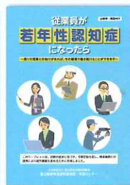
企業等・職場向けリーフレット