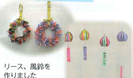
リース、風鈴を 作りました