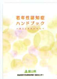
若年性認知症ハンドブック

ご希望の方は、富山県若年性認知症相談・支援センターへお問い合わせください。当センターのホームページからダウンロードできます。