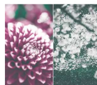
MIKA NINAGAWA 蜷川実花展

2022年1月13日(日) 14:00~15:30 富山県美術館 5F 富山県美術館