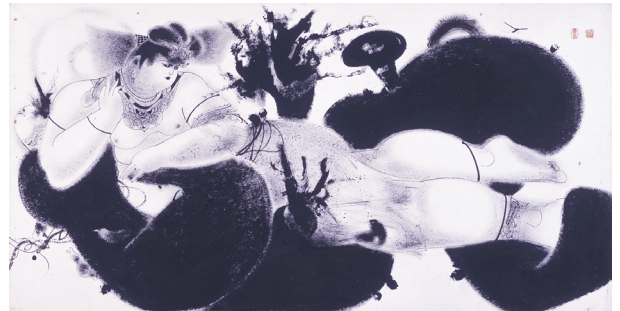
篁牛人《西王母と小鳥》昭和44年(1969)年 富山県水墨美術館蔵