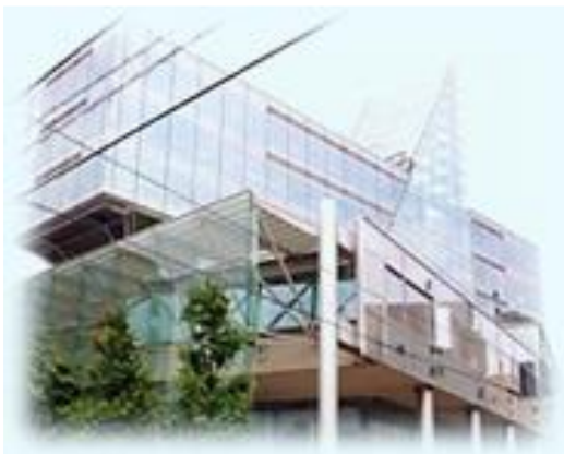
富山県総合福祉会館(サンシップとやま)