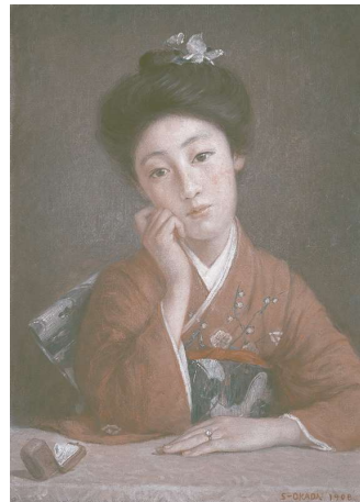
岡田三郎助《ダイヤモンドの女》 1908年 福富太郎コレクション資料室蔵