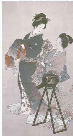
上村松園《よそほい》 1902年頃 福富太郎コレクション資料室蔵