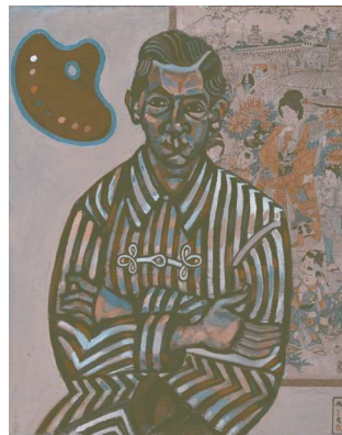
ジュアン・ミロ《アンリク・クリストフル・リカルの肖像》1917年 ニューヨーク近代美術館 ©Successió Miró / ADAGP, Paris & JASPAR, Tokyo, 2022 E4304