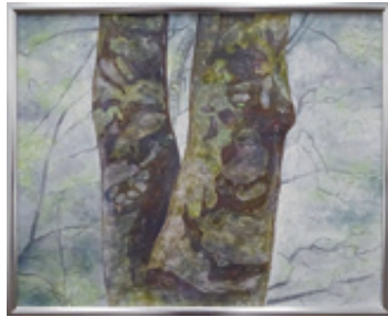
◆最優秀賞◆ 「樞の大木」 滝本 武 (魚津市)