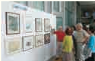
タレント祭りでの展示風景