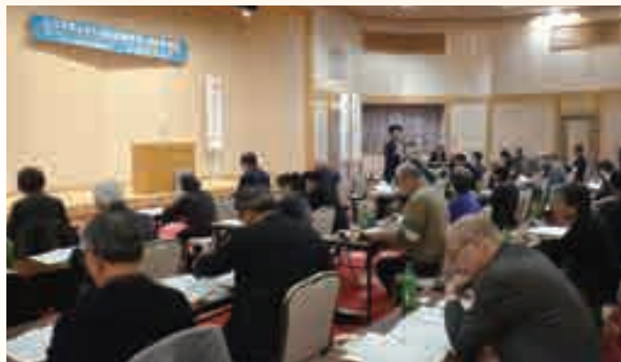
シニアタレント・語り部養成研修会

シニア世代の方々には、永年にわたって培った豊富な知識や技能などを、お持ちの方が多くいらっしゃいます。この方々の能力(タレント)をそのままにして使わないのは、もったいないことです。地域社会や子供たちのため、あなたの能力・知識を活用してみませんか。富山県いきいき長寿センターでは、あなたの意欲・やる気を応援します。