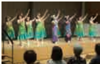
タレント祭りでのステージ発表