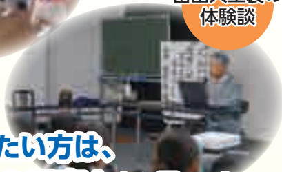
富山大空襲の 体験談